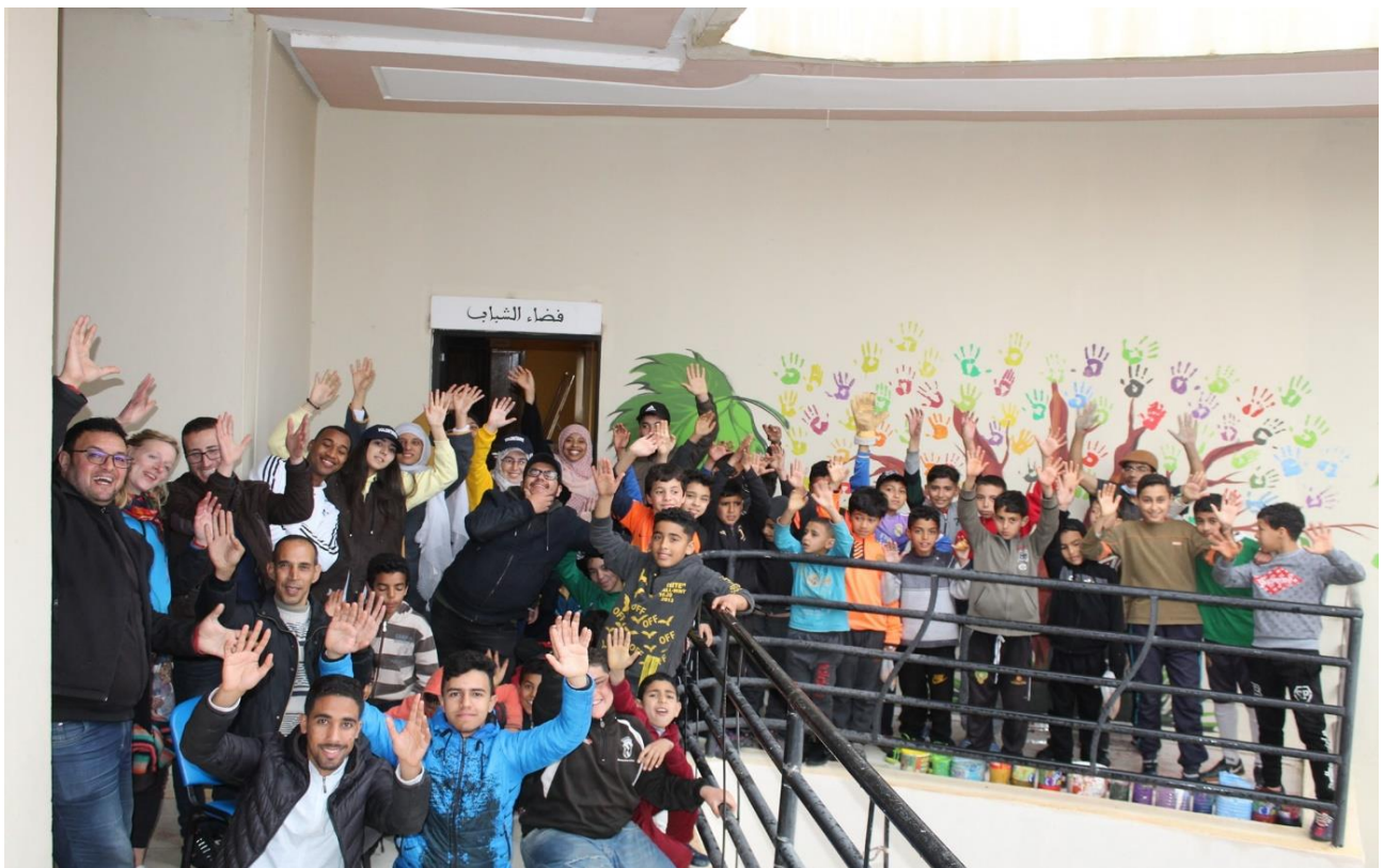
Enfin, une fête a eu lieu pour partager les moments de plaisir, et une pause thé.